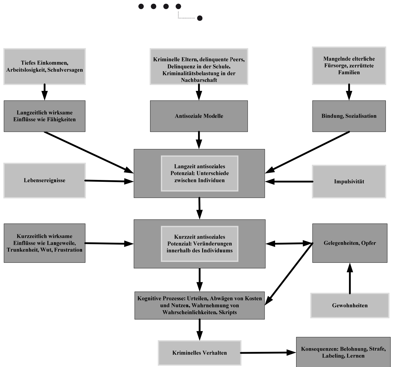
Abbildung 3 Integrated Cognitive Antisocial Potential (ICAP) Theorie (Farrington, 2006)