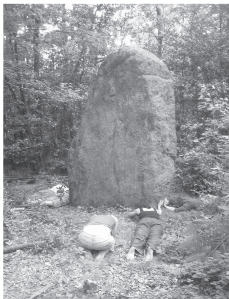
Foto eines neoschamanischen Trancerituals an einem Menhir (Megalith) in der Bretagne 2007

Einführung Das Projekt EnTrance widmet sich im Sinne einer «Kunst als Forschung» in drei künstlerischen Projekten aus den Bereichen Kunst, Theater und Visuals der Erkundung und Darstellung des «anderen Zustands». Begleitet werden die Produktionen durch ein geisteswissenschaftliches Team, das das Forschungsprojekt durch Arbeiten am Begrifflichen und Geschichtlichen unterstützt. Ziel ist es, Kunstwerke zu entwickeln, die einzelne Aspekte der Trance – als eines der traditionellen Wissenschaft schwer zugänglichen Bereichs – erfahrbar, darstellbar und damit zugleich verhandelbar machen.