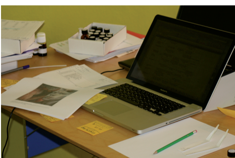
Nutzung des Parfumkonzepts in der Parfumentwicklung.