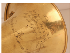
Saxhorn alto von Adolphe Sax (1866) aus der Sammlung Burri, die 19 Saxhörner verschiedener Pariser Hersteller besitzt.