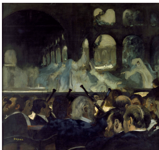
E. Degas, Le Ballet des Nonnes im 3. Akt von Meyerbeers Robert le diable , 1876, Victoria and Albert Museum, London.