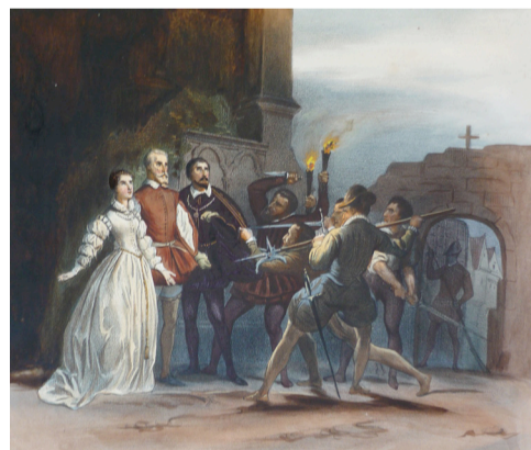
A. Devéria, Je ne crains rien de vous! im 5. Akt von Meyerbeers Les Huguenots , erschienen im Album de l'opéra , 1836, Paris.