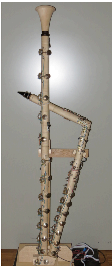
Laborfunktionsmuster aus dem BFH-Projekt Contrabass Clarinet Unlimited .

Die angestrebten Ziele sollen zu einem innovativen «Play-by-wire»-Musikinstrument führen, das trotzdem traditionell geblasen wird. Die in diesem Projekt entwickelten Neuerungen könnten in Zukunft auf die Bassklarinette und andere tiefe Blasinstrumente übertragen werden. Sie alle leiden unter ähnlichen technischen wie auch klanglichen Schwierigkeiten.