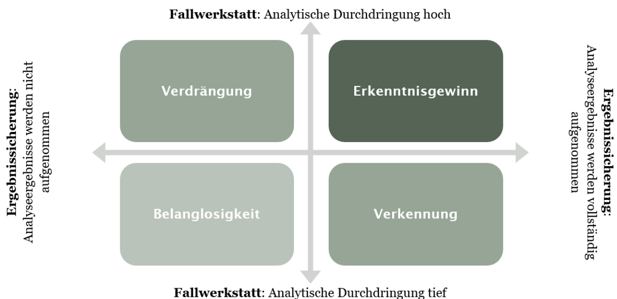
Abbildung 4: Typologie der beforschten Analyseeinheiten (eigene Abbildung)

Wie in Fehler! Verweisquelle konnte nicht gefunden werden. dargestellt, können die beforschten Analyseeinheiten vor allem hinsichtlich zweier Dimensionen unterschieden werden: Einerseits geht es darum, inwiefern in der Werkstatt überhaupt eine reichhaltige und vollständige Analyse gelungen ist; Andererseits stellt sich die Frage, inwiefern die Ergebnisse aus der Fallwerkstatt von der fallbringenden Person (möglichst vollständig und unverfälscht) mitgenommen und in allfällige Handlungsoptionen übersetzt werden. Entlang dieser beiden Achsen können die beforschten Analyseeinheiten in vier Haupttypen eingeteilt werden. Die Typen werden im Anschluss an die Darstellung beschrieben.