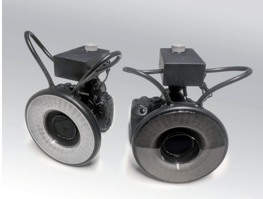
Erster Prototyp der MATIS-Kamera mit LED-Ringlicht und Controller.