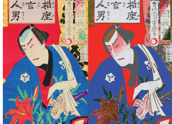
Links: Holzschnitt Fünf Personen im Gespräch , 1887, Japan, Bernisches Historisches Museum.; Rechts: Testergebnis der farbkodierten Pigmentklassifizierung.