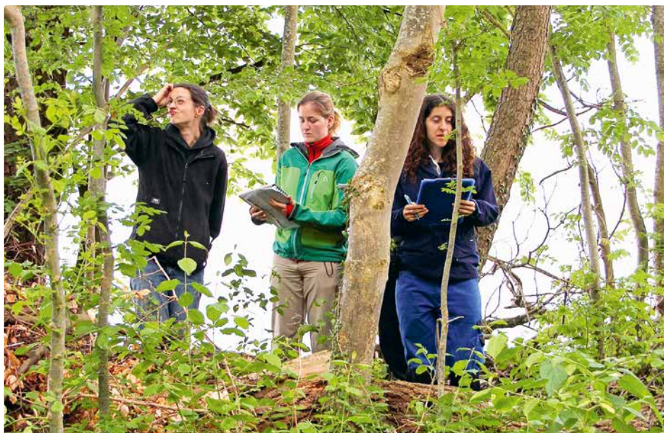
Un pied dans la pratique : des étudiantes collectent des données.

À partir de la deuxième année, vous approfondissez vos connaissances et vous spécialisez dans l'une des trois orientations proposées. Grâce aux travaux de projet qui font la part belle à la pratique, vous apprenez à mettre en application des notions théoriques. Les modules à option et le minor facultatif vous permettent d'affiner davantage votre profil. Vos études s'achèvent par un travail de bachelor.