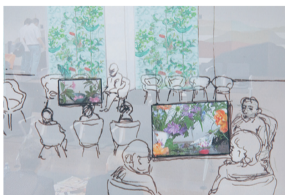
Planungsskizze für die Warteraumgestaltung «beobachtungsorientiert». (Bild: Copa & Sordes)