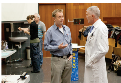
Interdisziplinäre Projektaushandlung.