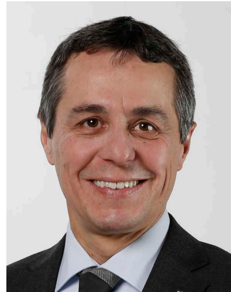
Ignazio Cassis, FDP