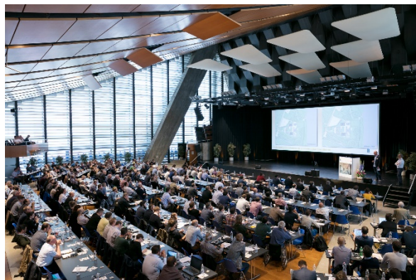
Holzbautag Biel 2018: Blick in den Saal