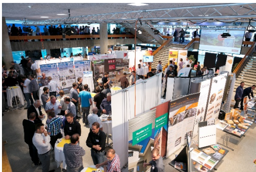
Holzbautag Biel 2018: Blick in die Ausstellung