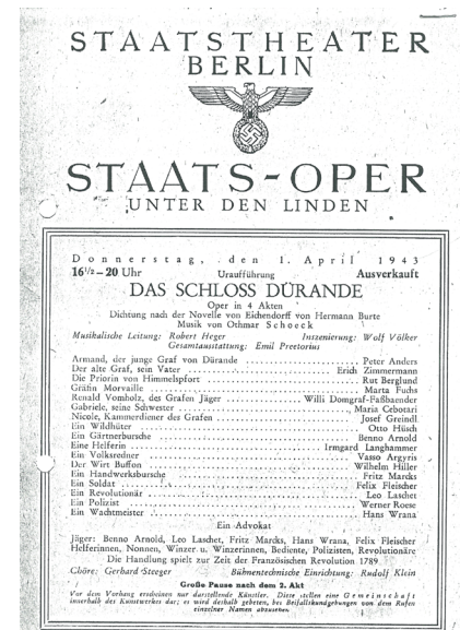
Besetzungsliste aus dem Programmheft der Uraufführung.