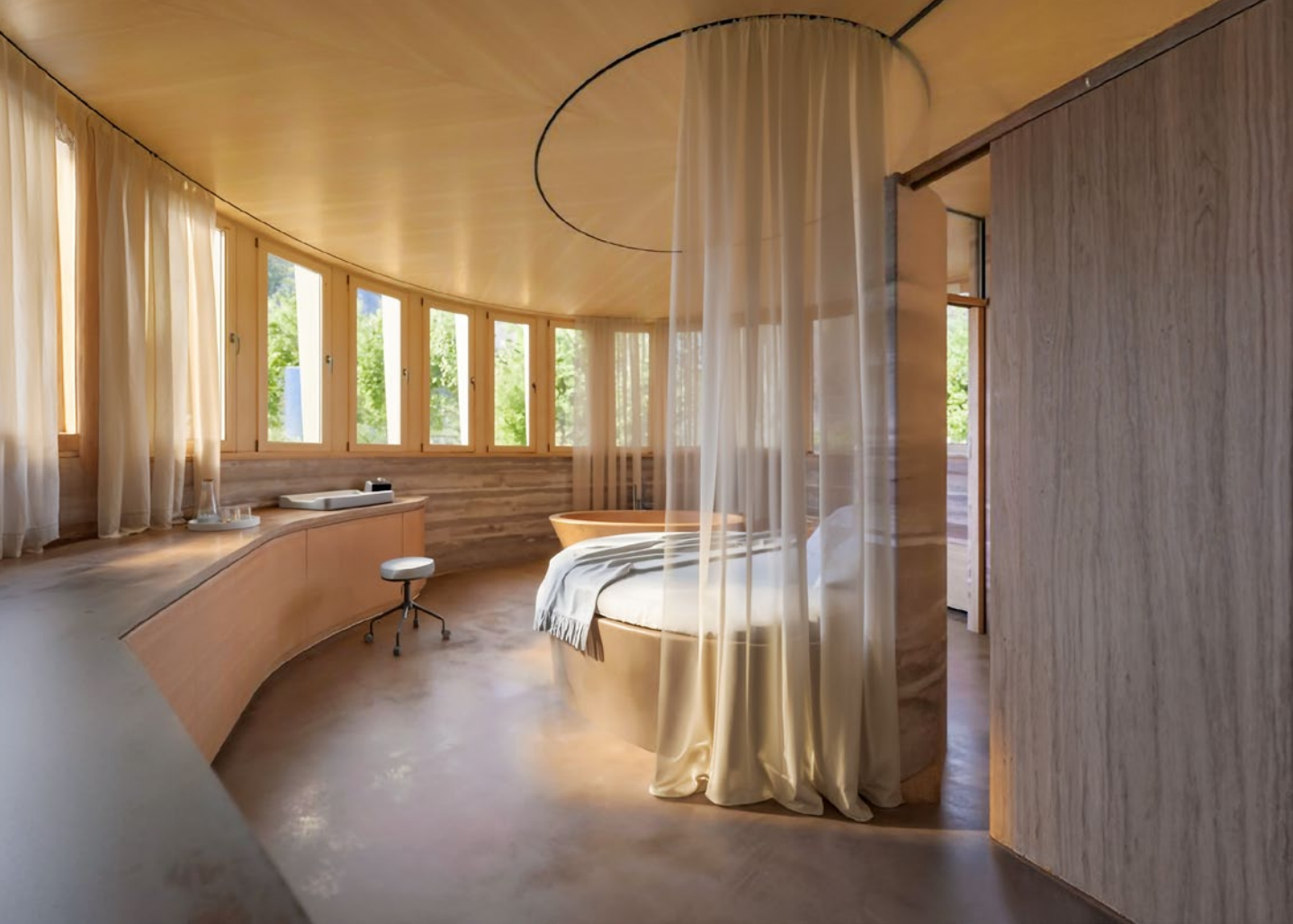
So könnte ein Geburtspavillon aussehen.