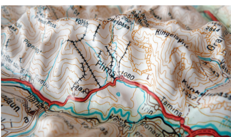
Flimser Bergsturz. (Bild: Florian Dombois)

Der Bergsturz von Flims, einstmaliges geologisches Extremereignis, ist heute in der Landschaft kaum mehr zu erkennen. Ziel des Forschungsprojekts ist es, den Grosskörper der Absturzmasse mit künstlerischen Mitteln erfahrbar zu machen, einschliesslich einer Auseinandersetzung mit dem eigentlichen Sturzereignis vor 10'000 Jahren. Ausgangsthese ist dabei, dass neue und ganz spezifische Sichtweisen entstehen, wenn mit künstlerischen Strategien bestimmte Aspekte des Bergsturzes in der Landschaft präpariert werden. Indem künstlerische Arbeitsprozesse als präparierende Verfahren entwickelt und beschrieben werden – sowohl in Überschneidung und Abgrenzung zu wissenschaftlichen Präparierungsweisen als auch in Abgrenzung zu modellierenden Verfahren in künstlerischen Arbeitsprozessen – können zudem an der Schnittstelle des Präparats sowohl die Spezifika künstlerischer und wissenschaftlicher Darstellungsformen als auch der Mehrwert einer Kunst als Forschung aufgezeigt werden.