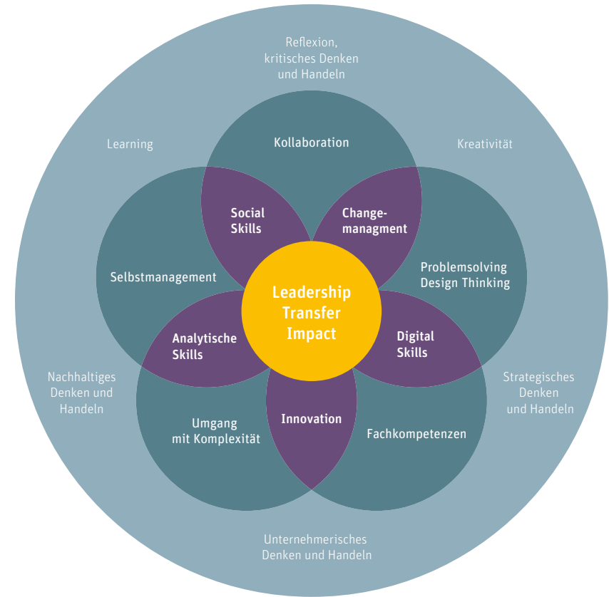
Abbildung Studiengangübergreifendes Kompetenzmodell der BFH Wirtschaft

Durch die hybride Gestaltung von Lernprozessen stärken und erweitern unsere Studierenden zudem ihre digitalen Kompetenzen, erlernen die Anwendung verschiedener und mittlerweile im Berufsalltag unverzichtbarer Apps und Tools und verbessern ihre Präsentationstechniken.