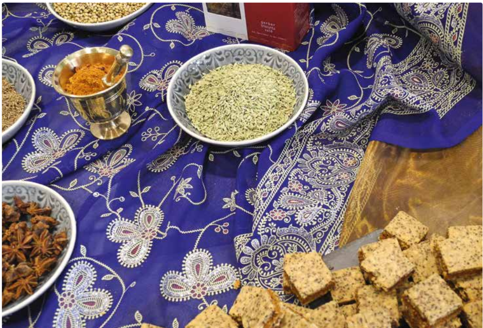
Resultat aus einem Modul für Lebensmittelinnovationen: Apérogebäck mit Ras el-Hanout.

Ab dem zweiten Studienjahr vertiefen Sie Ihre Kenntnisse gezielt und spezialisieren sich in einer der drei Vertiefungen (ab Seite 6). Dazu kommen Wahlmodule sowie zwei Semesterarbeiten. Mit der Bachelorarbeit schliessen Sie Ihr Studium ab.