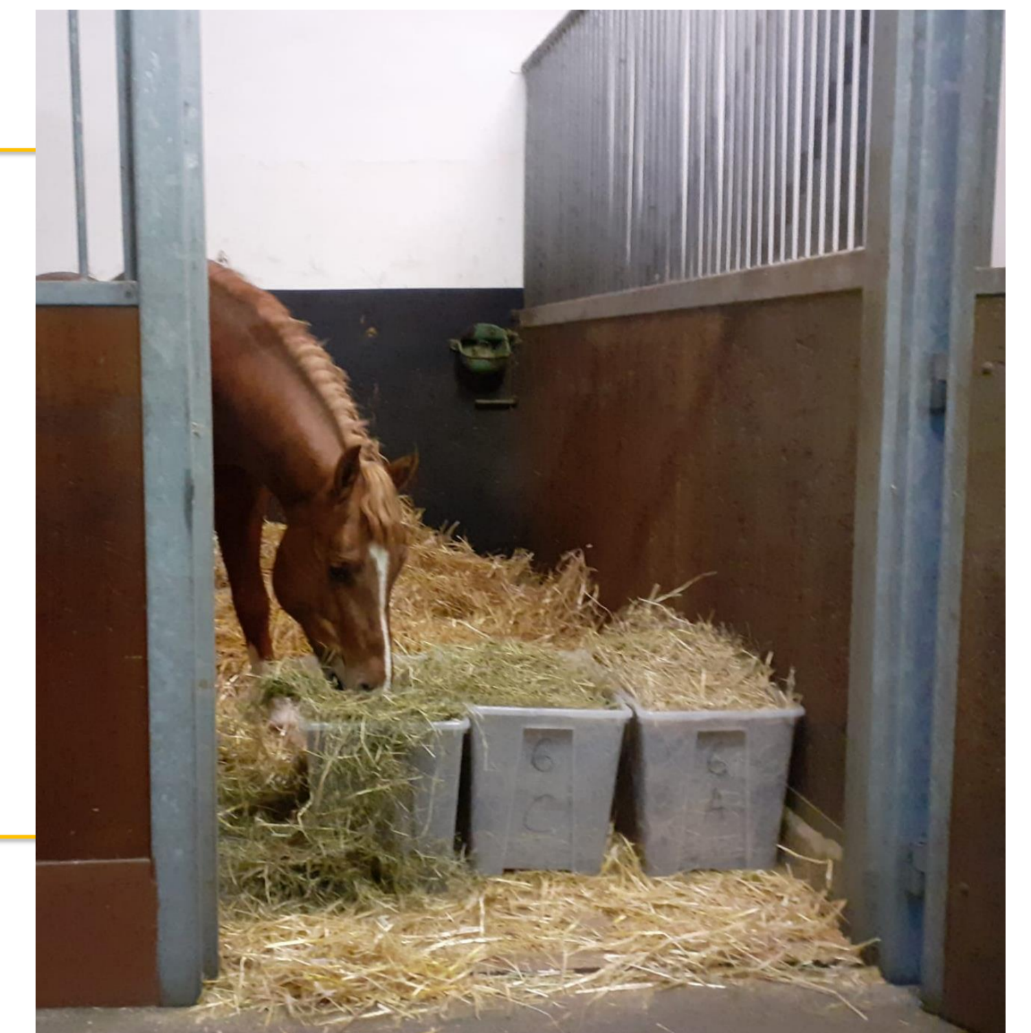
Figure 1: Test de préférence avec un cheval FM