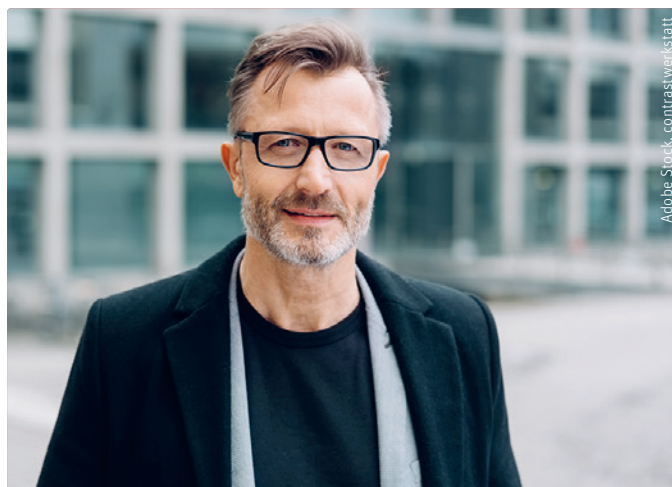
Persona 1: Daniel Favre umsorgt seine Frau.

Einer dieser kondensierten Typen – sogenannte Personae – ist zum Beispiel Daniel Favre. Er betreut seine Ehefrau, seit sie vor vier Jahren einen Unfall erlitt. Er ist beruflich Vollzeit tätig und hat zur Unterstützung seiner Frau ein Betreuungsnetzwerk aufgebaut, auf das er während seiner Arbeitszeit und manchmal am Wochenende zurückgreifen kann. Am Morgen hilft er seiner Frau aus dem Bett und assistiert ihr beim Ankleiden und Frühstück. Sobald er gegangen ist, übernimmt ein Team Stu-