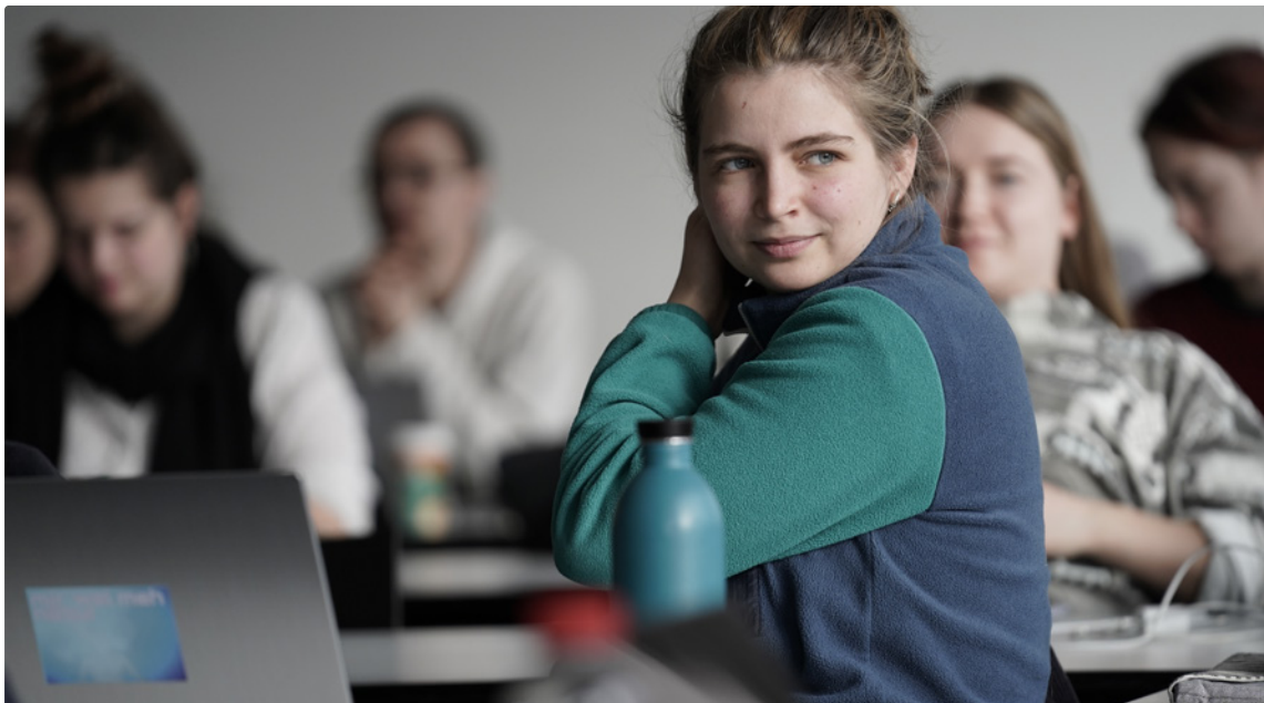
Religion weckt bei den Studierenden Neugier.

Diese Fragen der Studierenden stehen exemplarisch für Fragen, die wohl viele Menschen und viele Sozialarbeiter*innen bewegen. Doch sie werfen ihrerseits Fragen auf, denn es scheint, als werde Religion vor allem als