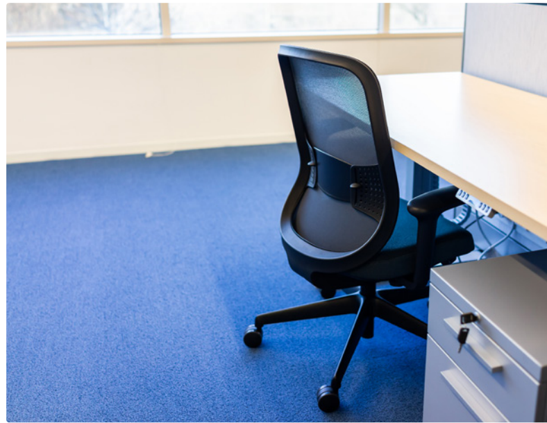
Arbeitsplätze in Sozialdiensten bleiben oft unbesetzt.