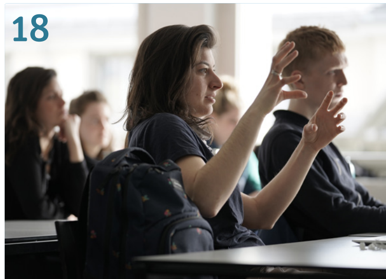
Religion und Soziale Arbeit: Was Studierende zur Erforschung des Themas beitragen