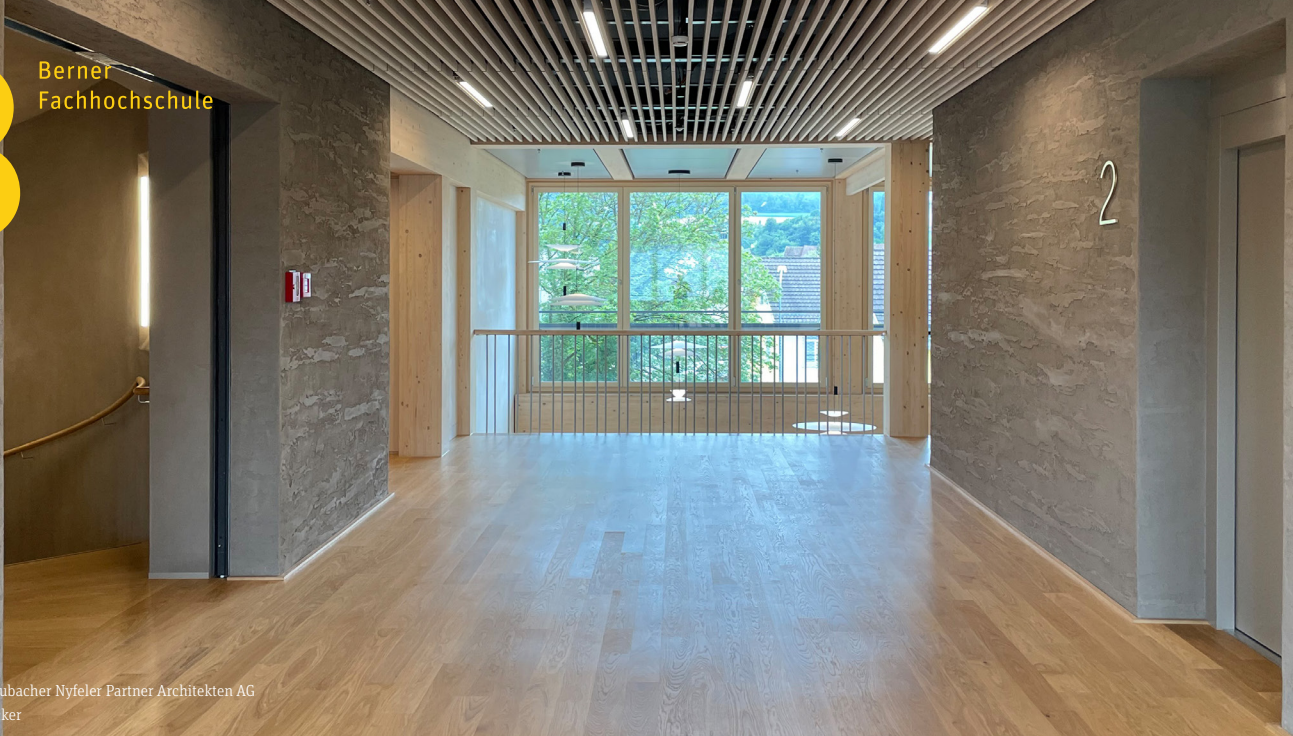
Architektur: Flubacher Nyfeler Partner Architekten AG