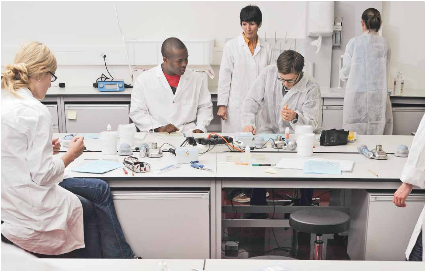
Associer la théorie et la pratique : les journées de formation à la HAFL

La HAFL tient une liste regroupant des sociétés suisses du secteur agroalimentaire. Il s'agit en principe de structures qui forment également des apprenti-e-s. Le responsable des stages en Sciences alimentaires à la HAFL est là pour vous aider à trouver une place si vous en avez besoin.